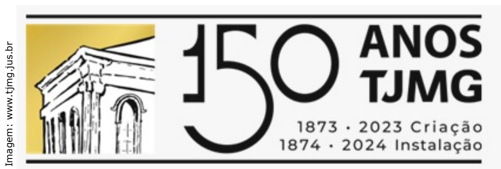
Logomarca comemorativa do Sesquicentenário do TJMG

O então "Tribunal da Relação" de Minas Gerais foi criado em 6 de agosto de 1873, por ato do imperador Dom Pedro II. A Corte foi solenemente instalada a 3 de fevereiro de 1874, em Ouro Preto, no secular sobrado localizado na rua Conde de Bobadela (antiga rua Direita). No imóvel, que, 100 anos antes, fora residência do tenente-coronel Francisco de Paula Freire de Andrade, realizaram-se as principais reuniões secretas da Inconfidência Mineira. Ali teria sido idealizada e elaborada a bandeira dos inconfidentes, posteriormente adotada pelo Estado de Minas Gerais.